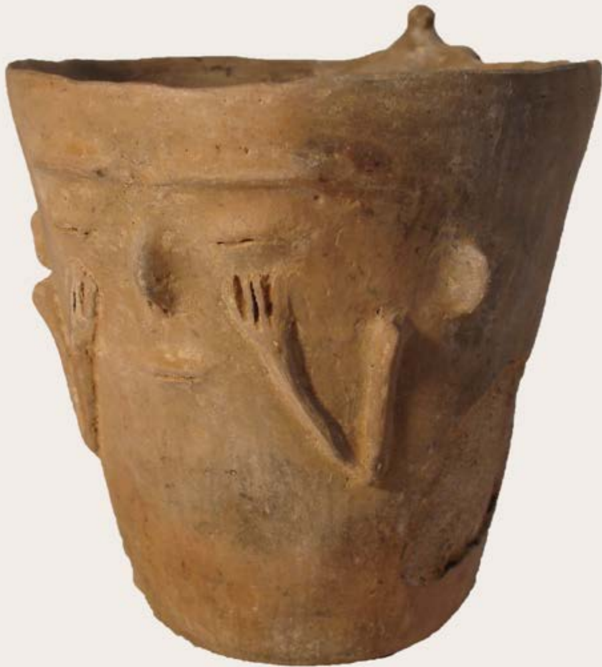
Vaso antropomorfo Cerámica