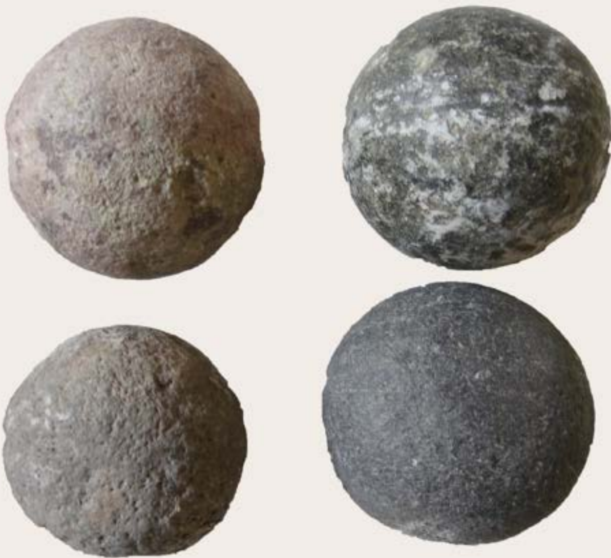
Bolas de boleadora Roca volcánica