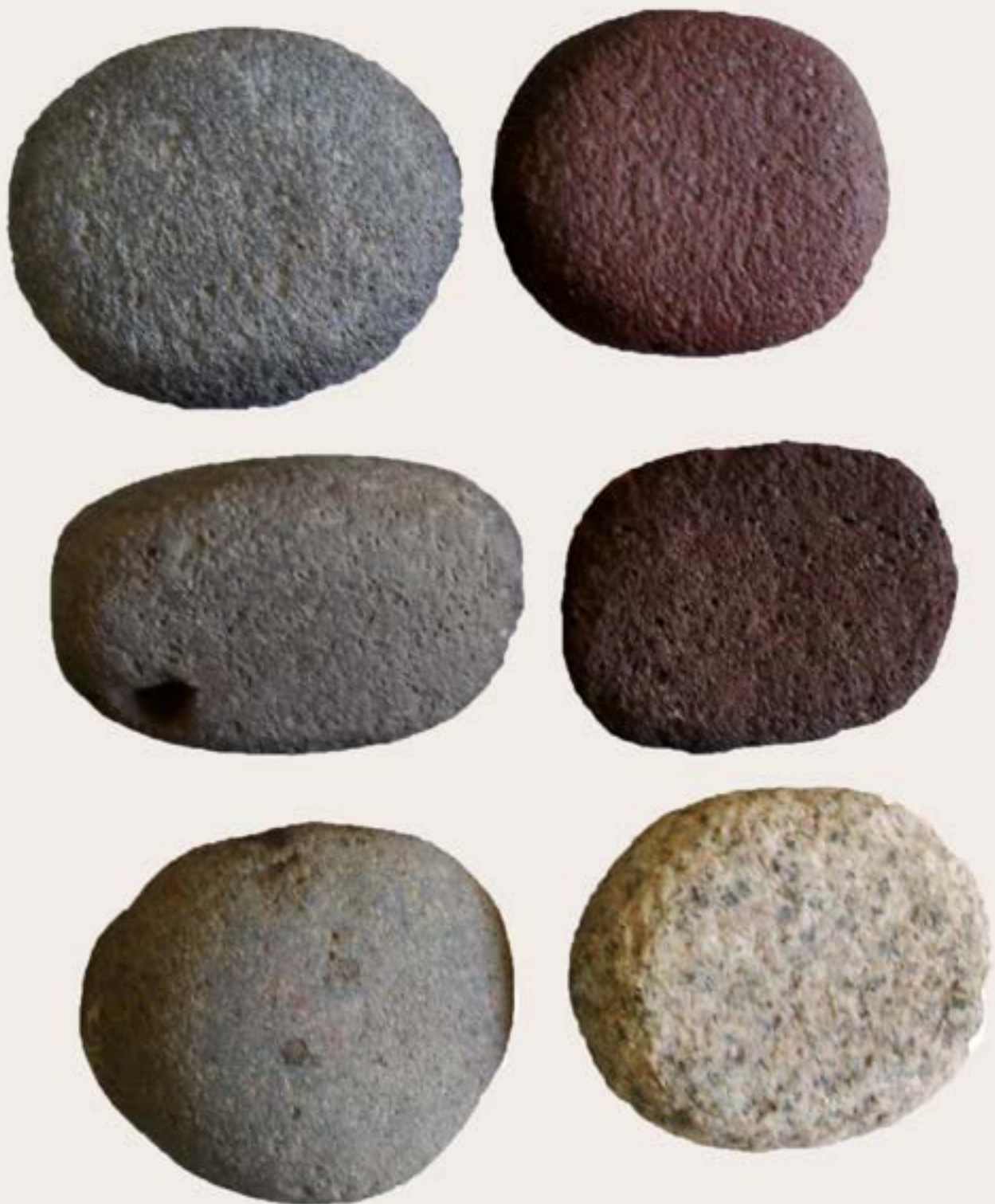
Manos de mortero roca volcánica